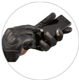
pro dotykové obrazovky