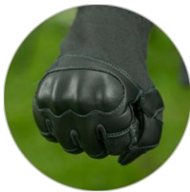
Impacton PU chránič kloubů