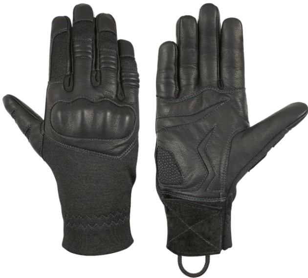
TARA Short Black